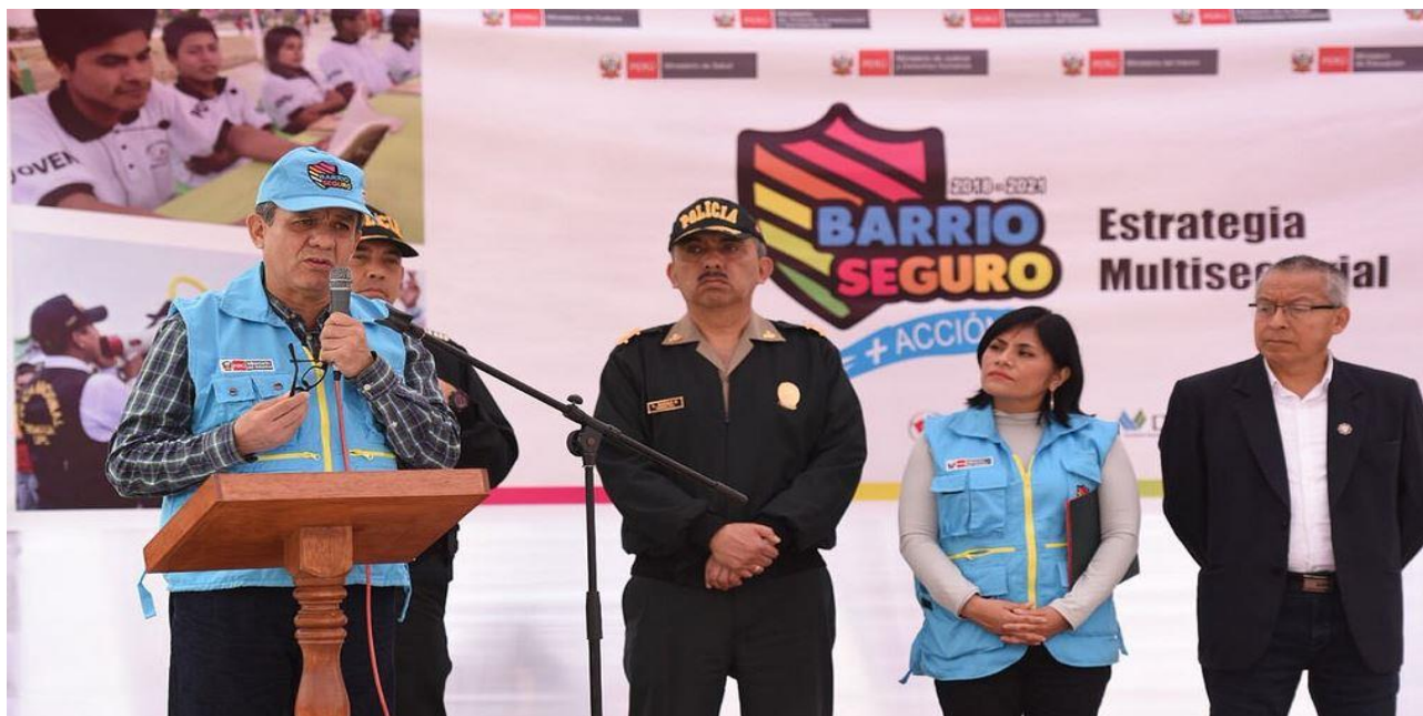
Ministro del Interior, Mauro Medina, instala Barrio Seguro en el distrito de San Clemente en la ciudad de Pisco