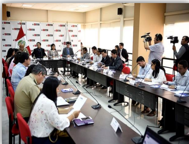
Instalación de la Comisión Multisectorial BS

El 16 de marzo de 2018, mediante Decreto Supremo N° 003-2018-IN, se crea la Comisión Multisectorial Barrio Seguro con el objetivo de fortalecer el cumplimiento de los compromisos y presencia de sectores en los barrios. En ella participan representantes de los Ministerios de Educación, Desarrollo e Inclusión Social, Salud, Cultura, Transportes y Comunicaciones, Trabajo y Promoción del Empleo, Vivienda, Construcción y Saneamiento, Mujer y Poblaciones Vulnerables, DEVIDA, entre otros.