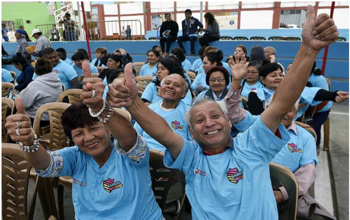
Inauguración de Barrio Seguro en Carmen de La Legua, Callao