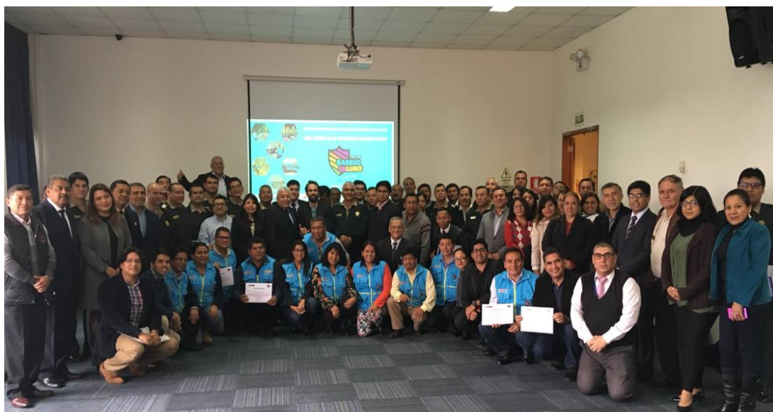
Encuentro Nacional de Actores Locales para la prevención del delito

La actividad fue inaugurada por la Viceministra de Seguridad Pública, Nataly Ponce, y contó con la participación de expertos internacionales y nacionales en temas de seguridad ciudadana y policía comunitaria.