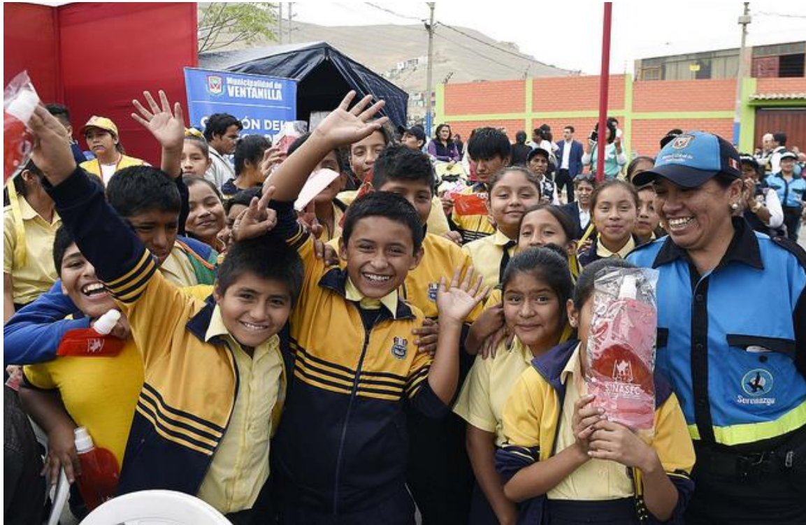
Inauguración de Barrio Seguro en Ventanilla, Callao