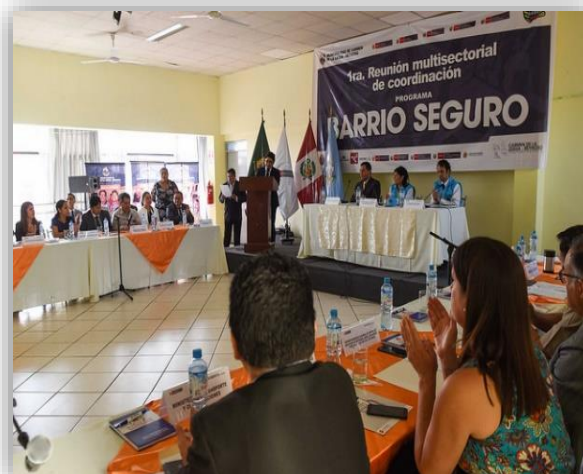
Sesión Descentralizada de la Comisión Multisectorial BS en el Callao