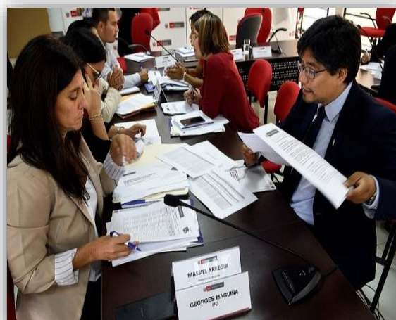
Mesas Técnicas Territoriales