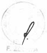
..... CARLOS MORAN SOTO MINISTRO DEL INTERIOR